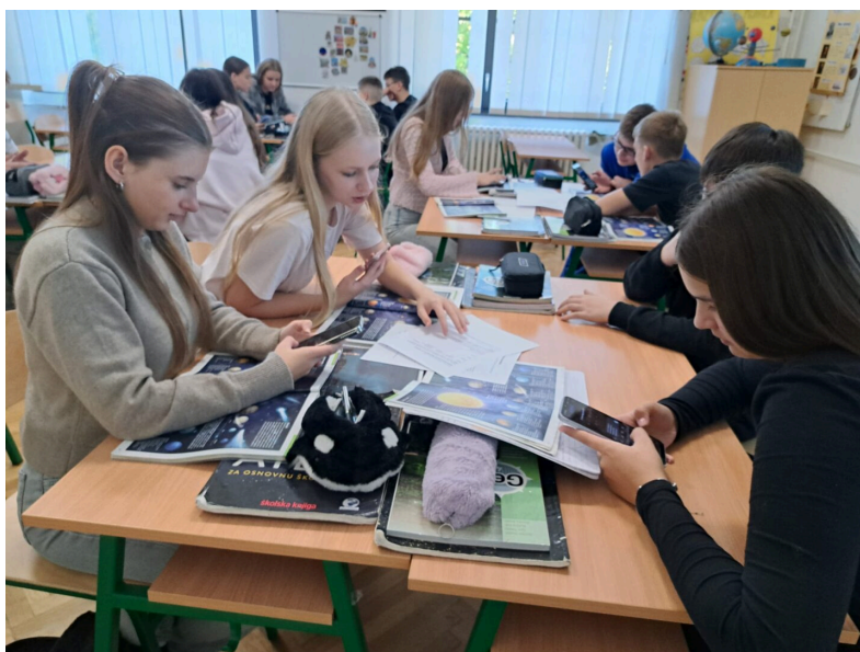
Slika 4.: Integrirana nastava Geografije

U skladu s temama ISLM-a i WSW-a, učenici osmih razreda na satu su Geografije sudjelovali u aktivnostima istraživanja svemira uz pomoć umjetne inteligencije pod nazivom Svemir na dlanu (Osnovna škola Ljudevit Gaj Krapina, 2025k). Učili su kako koristiti UI alate kao pomoć u učenju, ali i kako kritički promatrati tehnologiju, razlikovati provjerene informacije na pouzdanim izvorima od onih koje generira stroj. Završni dio sata bilo je generiranje fotografija pomoću UI-a te su tako vizualizirali budući život u svemiru (Pracaić, 2025e).