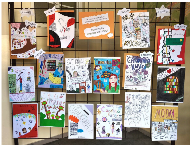
Slika 5.: Likovni natječaj

Likovni natječaj Nacrtaj knjigu koja priča bio je nastavak priče o knjigama. U njemu su sudjelovali petiši i šestaši, koji su likovnim radovima prikazali knjigu kao nositeljicu priče i emocije. Pristigli radovi istaknuli su se originalnošću i visokom razinom kreativnosti. Povjerenstvu je bilo teško odabrati najbolje, a oni najuspješniji nagrađeni su prigodnim poklonima kao malim poticajem za daljnje stvaralaštvo i ljubav prema čitanju.