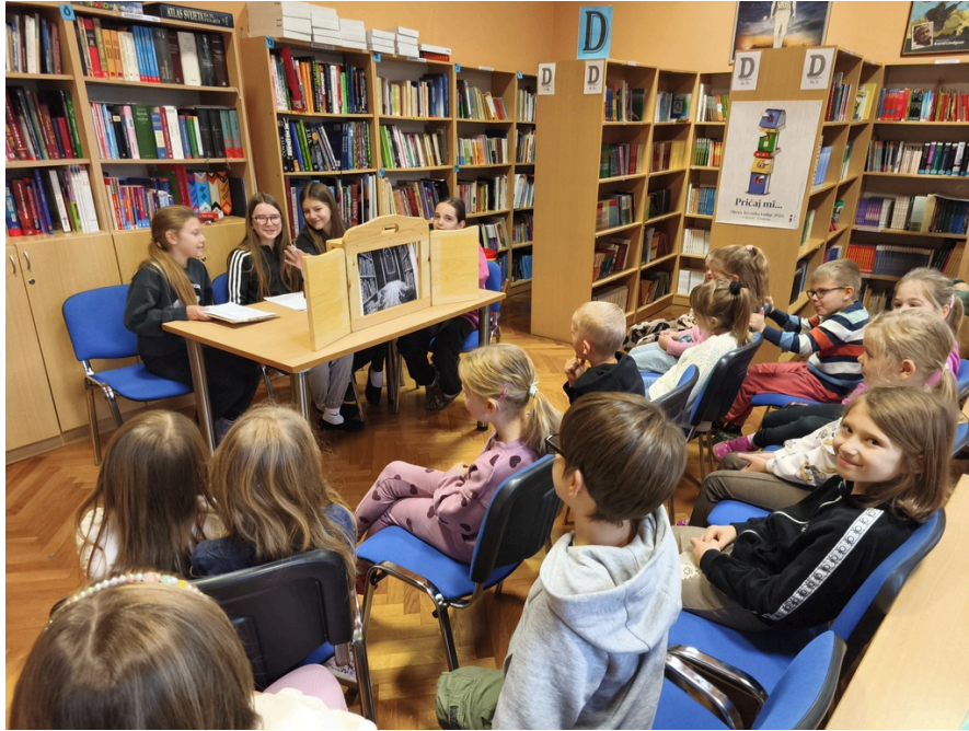
Slika 7.: Prvašići i kamišibaj