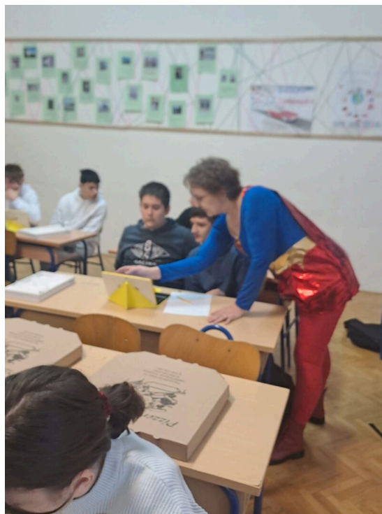
Slika 8.: Završnica

Kako je Mjesec hrvatske knjige u školi započeo plakatom koji su izradili učenici 8. b razreda, tako je i završio upravo s njima. Spasi knjigu – pronađi izgubljene riječi (Pracaić, 2025a) u obliku escape rooma i knjižničarkino pojavljivanje u kostimu superjunakinje snažno su simbolički povezali početak i kraj projekta te naglasili poruku o trajnim supermoćima čitanja, znanja i kreativnosti. Učenici su za svoj trud i sudjelovanje bili nagrađeni pizzom , uz mnogo smijeha i ugodnog druženja, što je dodatno pridonijelo lijepom završetku ovogodišnjih aktivnosti (Pracaić, 2025c).