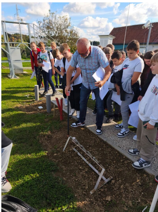
Slika 2.: Meteorološka postaja Popovci

U okviru Svjetskog tjedna svemira čija je ovogodišnja tema bila Živjeti u svemiru, provedene su aktivnosti usmjerene na istraživanje svemira i prirodnih pojava pod nazivom Galaksija mašte (Osnovna škola Ljudevit Gaj Krapina, 2025a). Aktivnosti nisu bile ograničene prostorom škole, već su uključivale terensku nastavu i posjet Meteorološkoj postaji Popovci. Tijekom posjeta učenici šestih razreda upoznali su se s meteorološkim mjerenjima, promatrali rad instrumenata te učili kako se podaci iz prirode prikupljaju, čitaju i interpretiraju (Osnovna škola Ljudevit Gaj Krapina, 2025b).