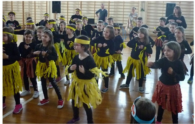
Slika 3.: Projekt Australija

Vidljiva je velika tematska raznolikost, ali najvažnije je da je svaka tema otvorila nova područja učenja i povezivanja s uobičajenim nastavnim sadržajima. U okviru svakoga projekta ostvaruju se i očekivanja međupredmetnih tema što je uvijek dodana vrijednost sadržaja.