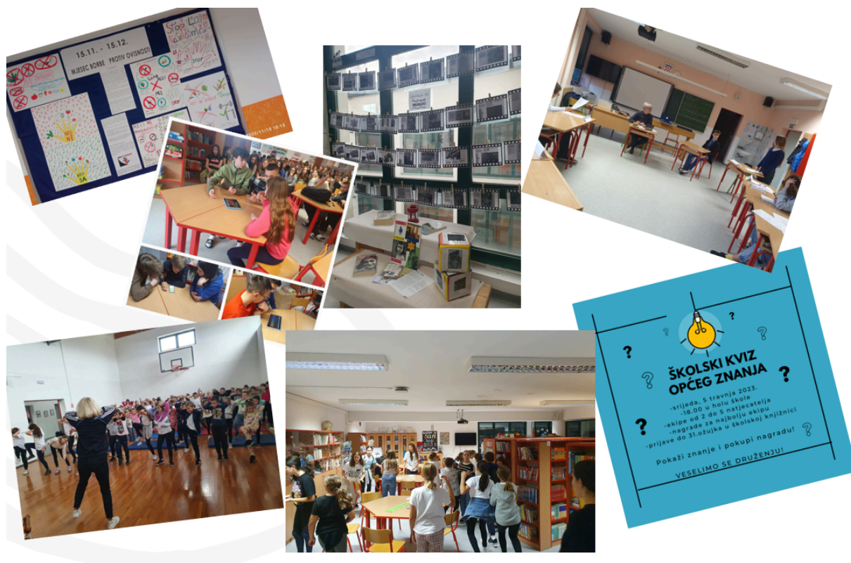
Slika 1.: Prikaz aktivnosti 1

Prva godina projekta bila je posvećena poticanju čitanja te razvoju emocionalne i socijalne pismenosti. Održane su aktivnosti poput školskog natjecanja u čitanju naglas, izložbe Sva lica knjiga , stvaranja blackout poezije povodom Dana sjećanja na Vukovar, aktivnosti Sudnica u sklopu Dana ljudskih prava te programa Čitaj mi! na Svjetski dan čitanja naglas. Knjižnica se tada afirmirala kao središte kulturnog i odgojnog života škole.