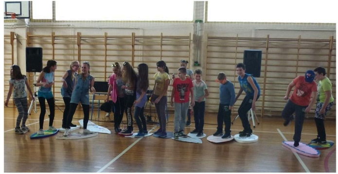
Projekt Australija 2016./2017.