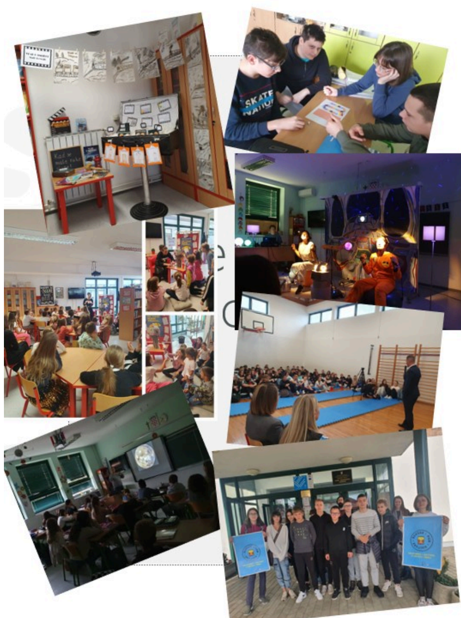
Slika 2.: Prikaz aktivnosti 2

Tijekom tri godine provedbe projekt je ostvario brojne pozitivne učinke: učenici su razvili čitateljske, komunikacijske i izražajne vještine, ojačali digitalne i medijske kompetencije, pokazali veću empatiju i ekološku osviještenost te pridonijeli stvaranju pozitivnije i suradničke školske klime. Školska knjižnica postala je središte kulturnog, odgojnog i socijalnog života Škole.