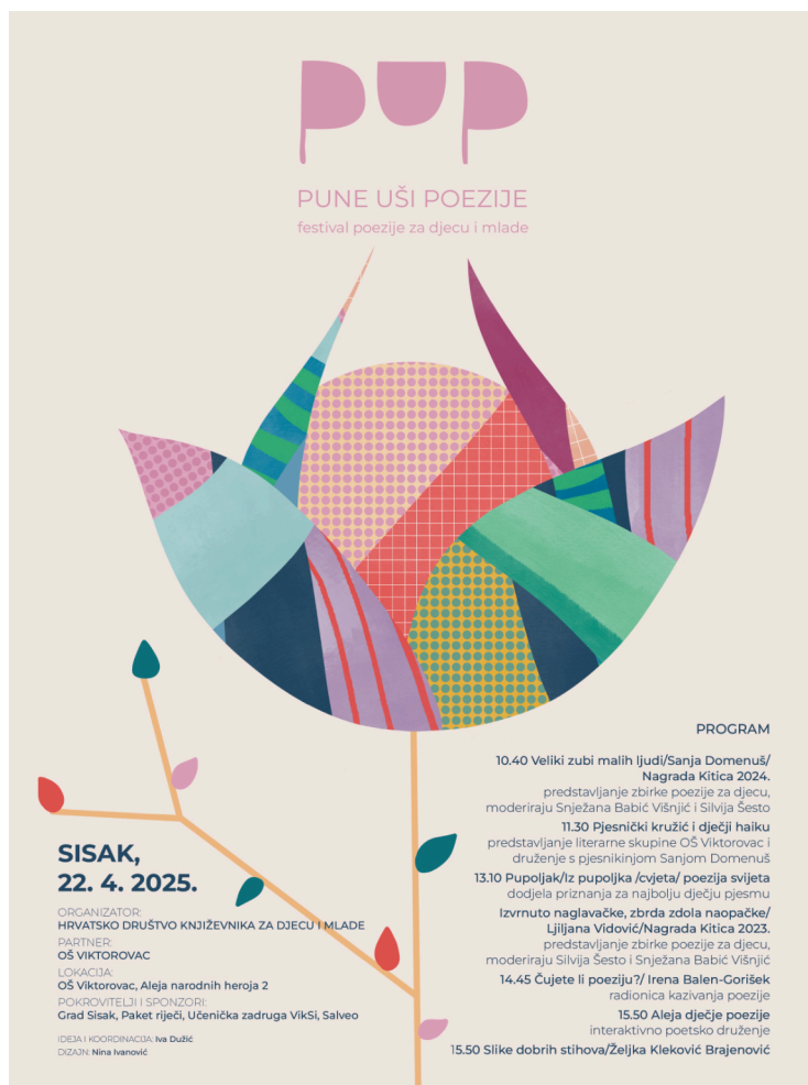
Slika 2.: Vizualni identitet PUP-a potpisuje Nina Ivanović.

Festival poezije za djecu i mlade Pune uši poezije (PUP) u svom je nultom izdanju na jednom mjestu okupio djecu i pjesnike u cjelodnevnom programu koji je slavio poeziju za djecu i mlade. U programu je sudjelovalo dvjestotinjak učenika razredne nastave.