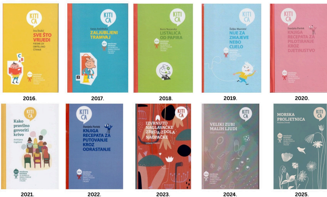
Slika 1.: Naslovnice zbirke pjesama nagrađenih nagradom Kitica Hrvatskog društva književnika za djecu i mlade