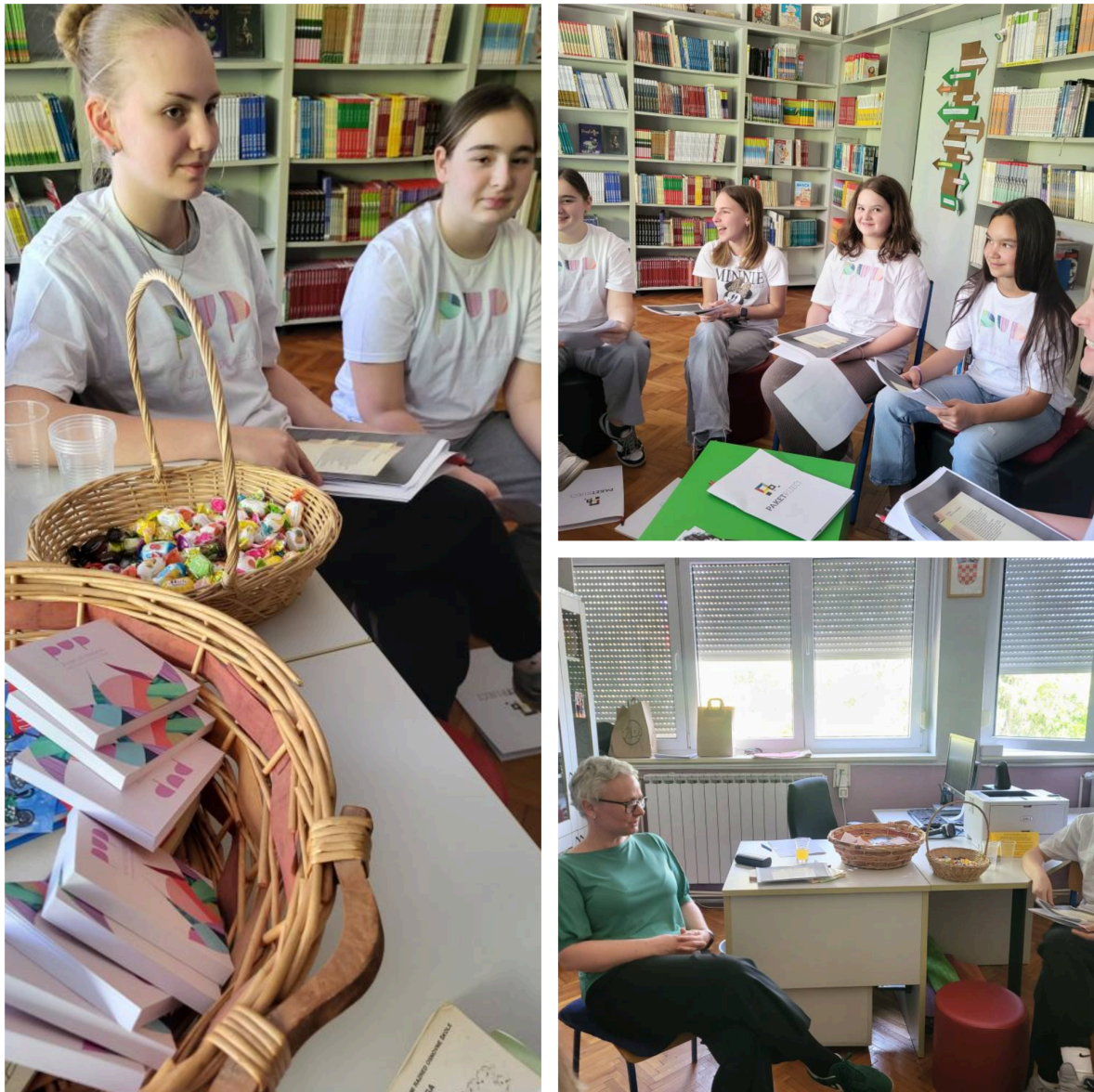
Slika 6.: Radionica kazivanja poezije