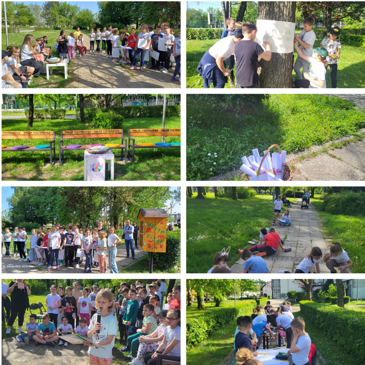
Slika 7.: Aleja dječje poezije

Kitice, poveznica dječjeg lirskog stvaralaštva i pjesništva za djecu, nit za tkanje budućnosti pjesništva, za djecu, mlade i odrasle. Također je primjer dobre prakse suradnje osnovnoškolske knjižnice s umjetničkom udrugom, projekt s potencijalom širenja i održivosti.