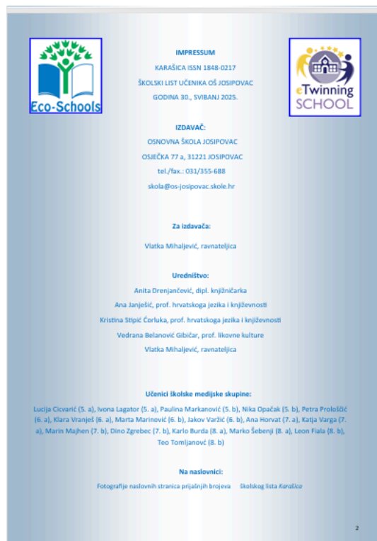
Slika 4. Impresum školskog lista Karašica , br. 30

U stvaranju sadržaja sudjeluju učenici izvannastavne skupine Novinari, koja je prije dvije godine promijenila naziv u Medijska skupina. Učenici sudjeluju u prikupljanju materijala, pisanju tekstova, praćenju događaja u školi, odabiru fotografija te oblikovanju sadržaja, uz mentorstvo učitelja i stručnih suradnika iz škole. Budući da se broj učenika, članova Medijske skupine, svake godine razlikuje, početkom nastavne godine određujemo zaduženja i timove koji će raditi na određenim rubrikama unutar školskog lista. Učenici se raspoređuju prema svojim sklonostima i željama uz vođenje učitelja i stručnih suradnika.